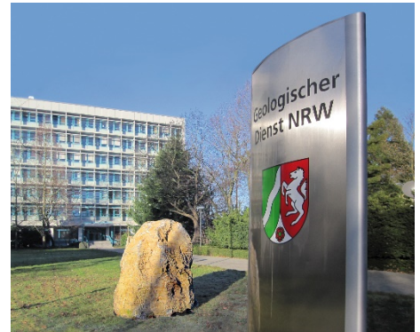
Geologischer Dienst NRW in Krefeld

Über die geplanten bodenkundlichen Kartierungen werden die betroffenen Kreisverwaltungen sowie die zuständigen Landwirtschaftskammern und Regionalforstämter rechtzeitig schriftlich informiert. In der Regel werden die Informationen im Amtsblatt oder durch Aushang veröffentlicht. Es wird um Verständnis dafür gebeten, dass eine persönliche Unterrichtung bei der Vielzahl von Grundstückseigentümer*innen oft nicht möglich ist.