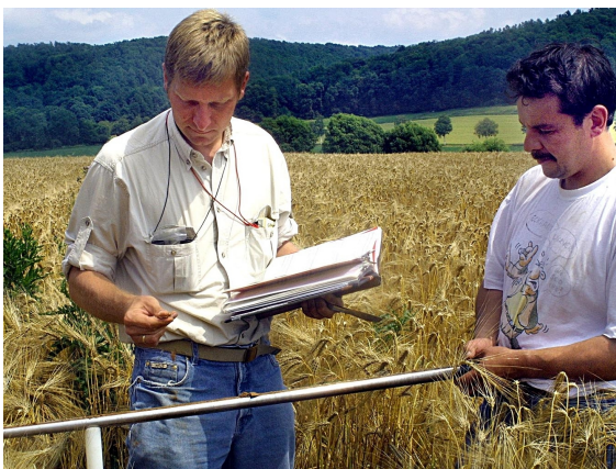
Beurteilung der Bodeneigenschaften durch den Geologischen Dienst

Danach sind die Mitarbeiter*innen und Beauftragten des Geologischen Dienstes NRW berechtigt, Grundstücke – nicht die Gebäude – zu betreten und die notwendigen Arbeiten vorzunehmen. Auf forstliche und landwirtschaftliche Belange und die Nutzung der Grundstücke wird soweit wie möglich Rücksicht genommen. Falls trotzdem durch die Arbeiten Schäden entstehen, werden diese nach den allgemeinen gesetzlichen Bestimmungen ersetzt.